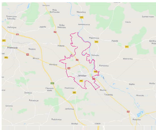
Rysunek 1: Granice miasta

Niewątpliwym atutem Jarosławia jest jego położenie i wynikające z niego dogodne warunki komunikacji z ważnymi sąsiednimi ośrodkami. Położony jest we wschodniej części województwa podkarpackiego. Miasto leży na pograniczu Podgórze Rzeszowskiego (zwanego również Podgórzem Jarosławskim) i Doliny Dolnego Sanu, w sąsiedztwie trzech gmin wiejskich: Jarosław, Wiązownica i Pawłosiów. Zlokalizowane jest na przebiegu ważnych szlaków komunikacyjnych Polski południowej. Miasto oddalone jest 55 km od Rzeszowa oraz 59 km od lotniska w Jasionce k. Rzeszowa. Od przejścia granicznego z Ukrainą w Korczowej Jarosław dzieli zaledwie 36 km. Ważnymi elementami układu drogowego są autostrada A4 (będąca elementem trasy europejskiej E40) przebiegająca po południowej stronie miasta w kierunku wschód-zachód (biegnąca od Jędrzychowic przy granicy z Niemcami do przejścia granicznego z Ukrainą w Korczowej) oraz droga krajowa nr 77 przebiegająca w kierunku północ-południe. W związku z bliskością autostrady, niedaleko miasta znajdują się dwa węzły autostradowe: Jarosław Zachód (łączy autostradę z drogą krajową nr 94) i Jarosław Wschód (łączy autostradę z drogą wojewódzką nr 880). Natomiast od strony północnej miasta biegnie droga krajowa nr 94, będąca alternatywną trasą dla autostrady. W 2012 r. otwarto obwodnicę miasta Jarosławia.